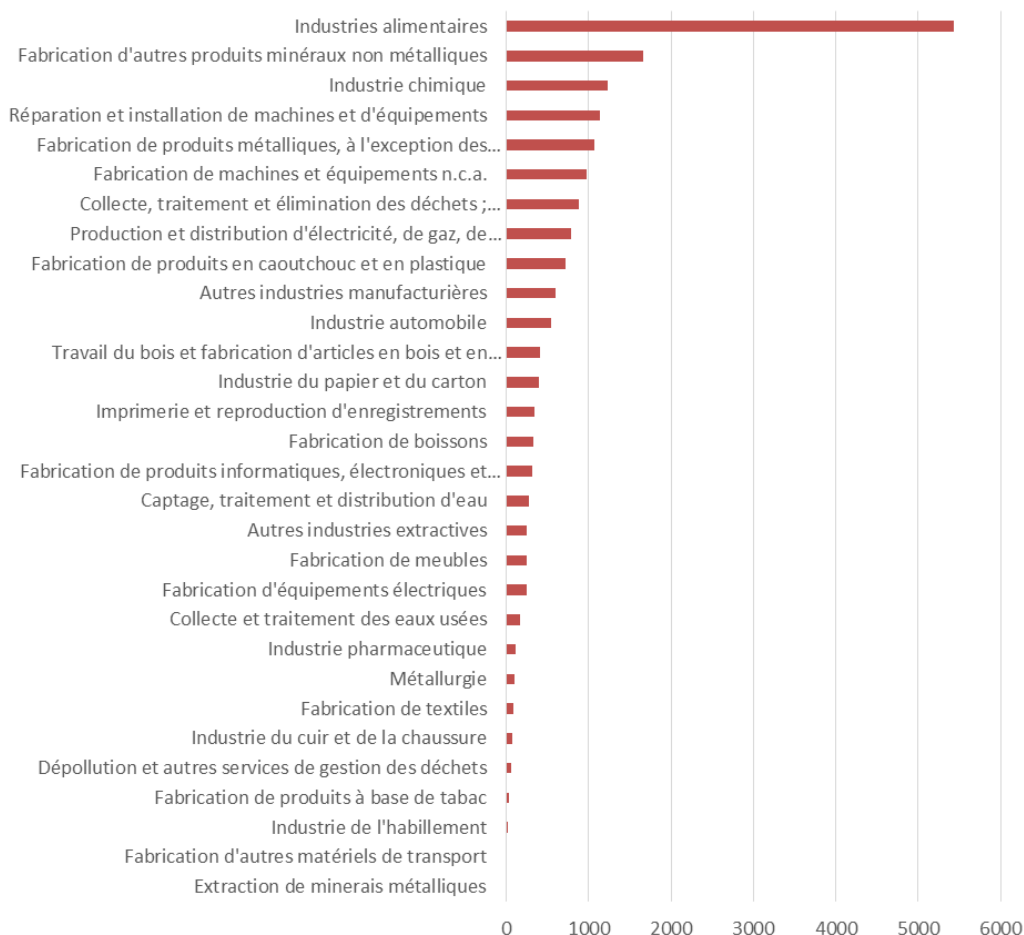
Les effectifs salariés par sous-secteurs industriels en Vaucluse

En Vaucluse, les industries alimentaires représentent 5 437 emplois salariés, soit près de 30% des emplois industriels du département.